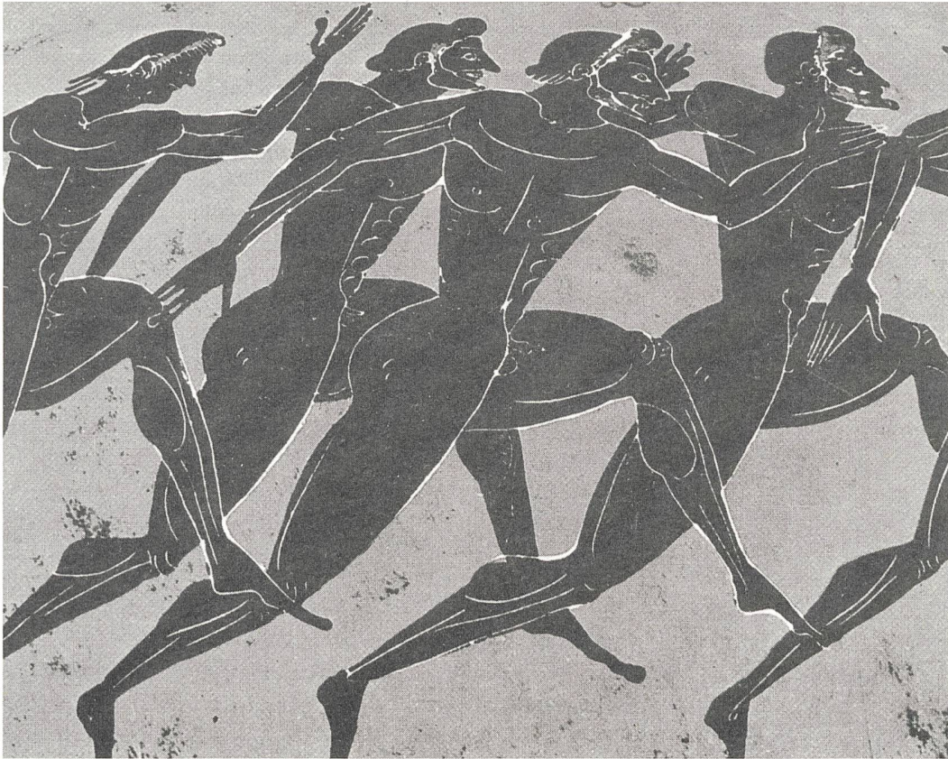
Wettkampf – Griechisches Vasenbild, Ende 6. Jahrhundert vor Christus

Schade, ich habe eine Bildaufnahme verpasst. Santa Marinella ist ganz nahe am Meer, das wusste ich nicht. Mein Badeanzug war im Rucksack nicht dabei. Ich wollte mit kniehoch aufgekremelter Hose ins Meer waten, zur Erfrischung. Am Badestrand standen die Hotels nahe und es stand der dickschädelige, alte Wächter und verlangte 4000 Lire. Ich sagte: «Nein, ich möchte nur bis zum Knie ins Wasser gehen.» Er behauptete, es koste trotzdem das Geld. Ich war stur, er war auch stur. Ich hätte sehr weit laufen müssen, um ausserhalb von Santa Marinella freien Strand zu finden. Ich wusste, die Zeit wurde knapp und ich wusste, dass ich es sowieso nicht mehr schaffen würde. Ich blieb im Dorf und ging zu einem anderen Strandabschnitt. Dortsah ich keinen Wärter. Plötzlich stand ein junger Wärter vor mir. Ich bat ihn, dass ich ein paar Minuten ins Was-