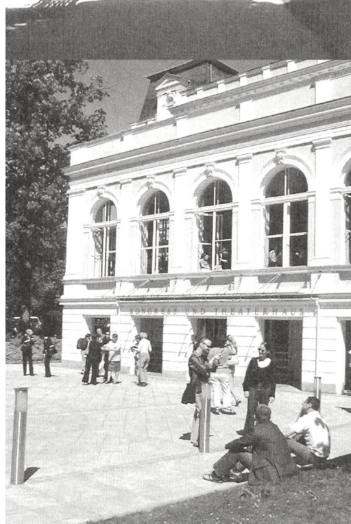
Eindrücke vom Kongress in Bad Ischl