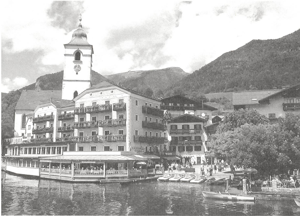
Das berühmte Weisse Rössl am Wolfgangsee