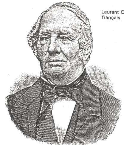
Laurent Clerc français

Somit ist verständlich wenn die Blüte der französischen Gehörlosenkultur zu Beginn des 19. Jahrhunderts eine ganze Reihe von hervorragenden Leistungen französischer Gehörloser hervorgebracht hat, welche sich mit der Gehörlosigkeit und der Gebärdensprache auseinander setzten.