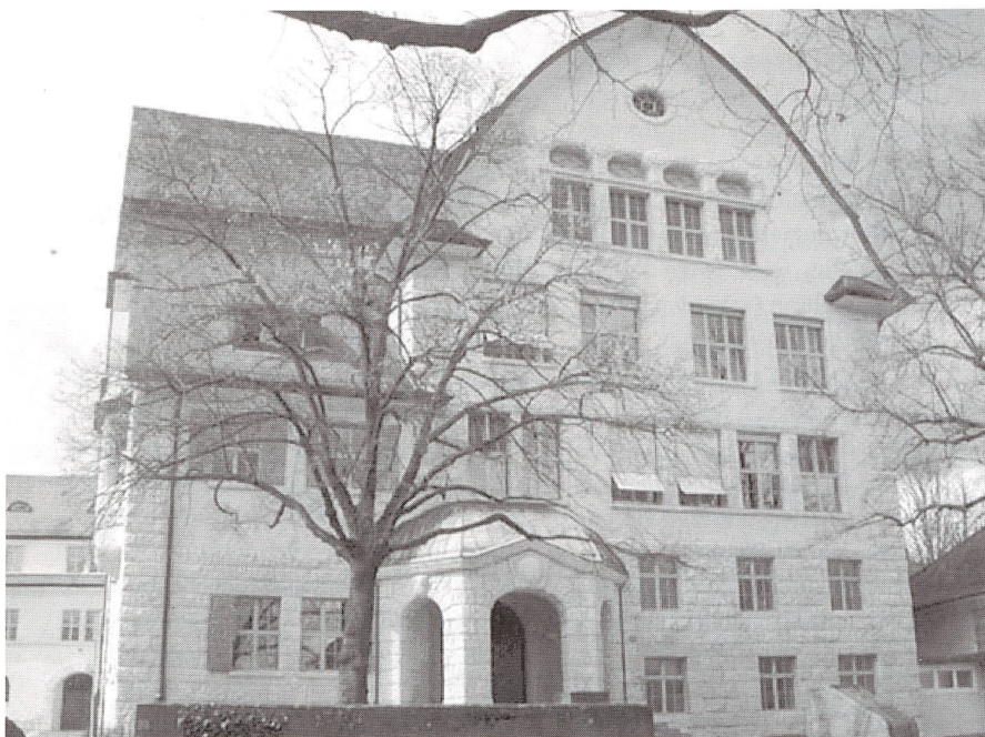
Schulhaus «Hans Asper» der Sekundarschule für Gehörlose (siehe Bericht ab Seite 4)