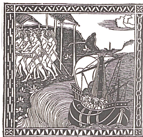
Fliehende Indianer vor Columbus. Holzschnitt in „Giuliano Dati“, Florenz 1495. Monographie rororo.