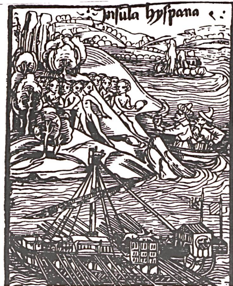
Die Landung auf Hispaniola. Holzschnitt in „Epistola Christofori Colom“, Rom 1493.

Columbus wurde rehabilitiert und konnte 1496 erneut mit sechs Schiffen nach Westen segeln. Am 31. Juli erreichte er die Insel Trinidad, passierte anschliessend die Paria-Halbinsel, um nach Haiti zu gelangen. In der dortigen Kolonie traten aber solche Missstände auf, dass der König einen neuen Gouverneur, Francisco de Bobadilla, ernannte. Columbus anerkannte den Gouverneur nicht, worauf ihn Bobadilla verhaften liess und im Oktober 1500 in Ketten nach Spanien zurückschickte. Mit dem Königshaus wieder versöhnt, durfte er in den Jahren 1502-1504 trotzdem noch einmal die Neue Welt besuchen, allerdings mit der Auflage, die Insel Haiti nicht zu betreten. Dann wurde es still um den grossen Entdecker. Am 19. Mai 1506 liess Columbus sein Testament beglaubigen. Am darauffolgenden Tag erlitt, fast unbeachtet, der Tod den noch nicht einmal fünfundsünfzigjährigen in Valladolid. Fünf Männer standen an seinem Sterbelager, seine beiden Söhne, sein Bruder Diego und die zwei vertrauten Freunde Fieschi und Méndez, welche keine drei Jahre zuvor durch eine waghalsige Kanufahrt von Jamaika nach Hispaniola dem in Seenot geratenen Admiral und seiner Mannschaft möglicherweise das Leben gerettet hatten.