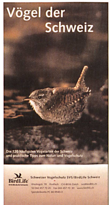
Die 120 häufigsten Vogelarten der Schweiz und praktische Tipps zum Natur- und Vogelschutz

Aktionspreis für alle vier CDs (Vol. 1-4, inkl. Vogelführer): CHF 100.-