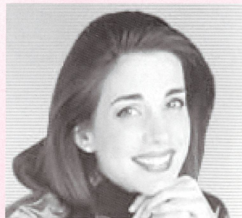
Heather Whitestone McCallum in ihrem Jahr als „Miss America“ 1995.