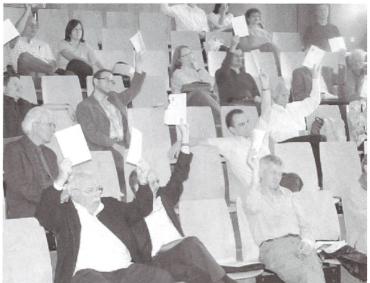
Abstimmung zur Statutenänderung