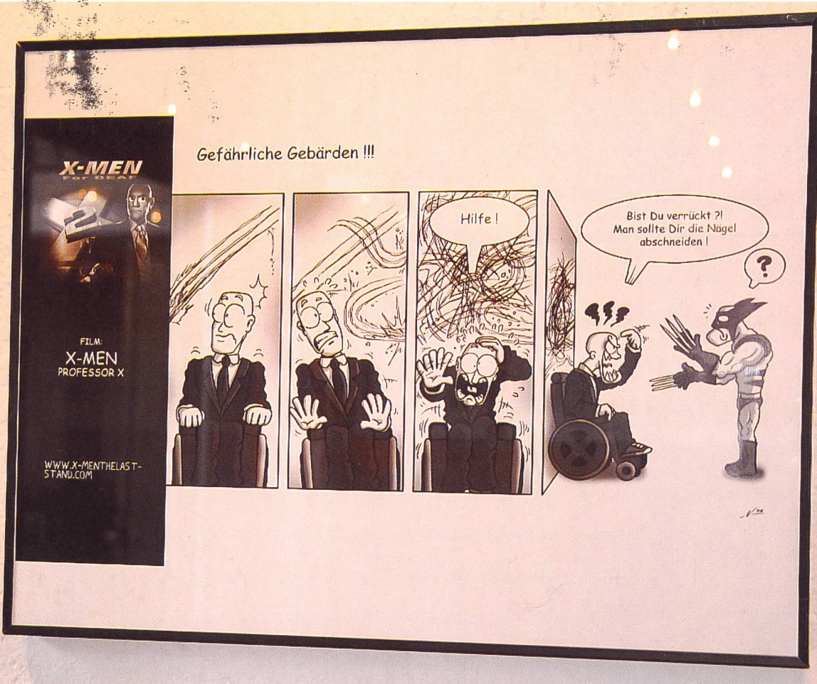
Die Wurzel der Sprechblasen von Hörenden ist in Form eines Pfeils dargestellt. Diejenigen der Gehörlosen werden abgeschnitten, um die Gebärden darzustellen.