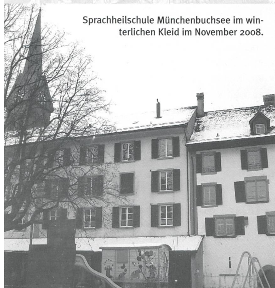
Sprachheilschule Münchenbuchsee im winterlichen Kleid im November 2008.