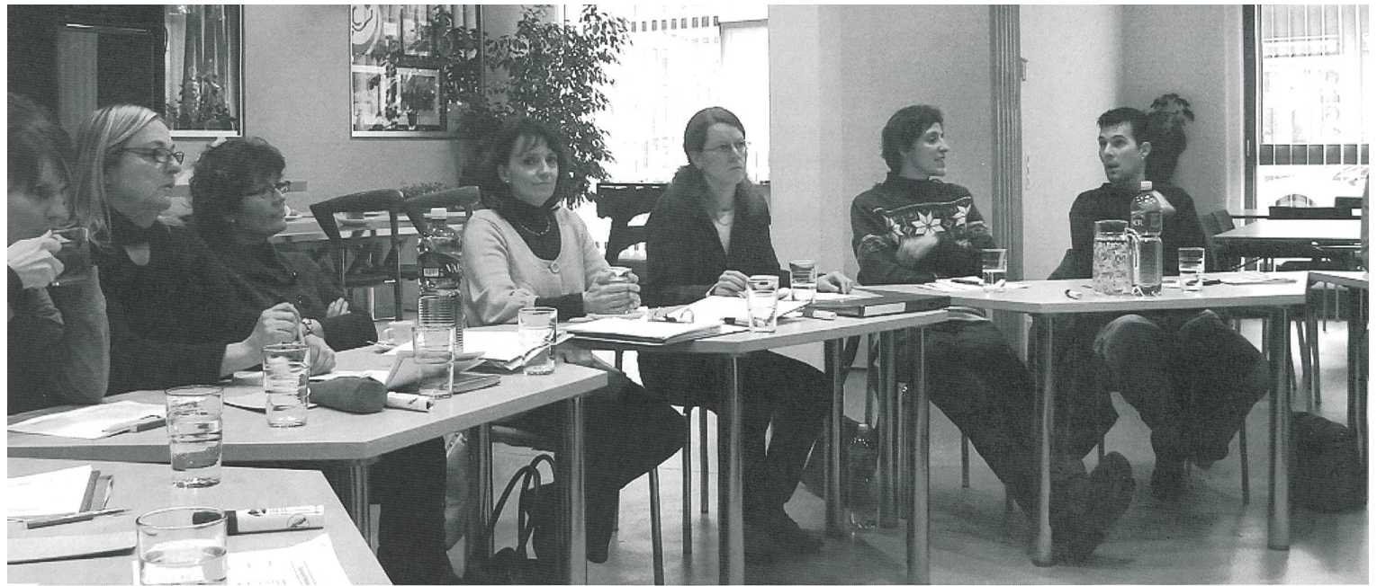
Die Teilnehmenden der Koordinationskonferenz Bildung folgen den Ausführungen über die Gestaltung der Datenbank aufmerksam.