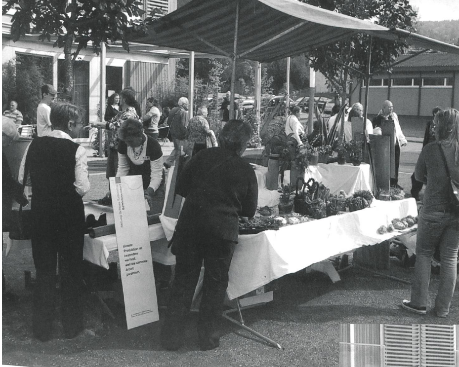
Es gibt viel zu bestaunen an den zahlreichen Marktständen.