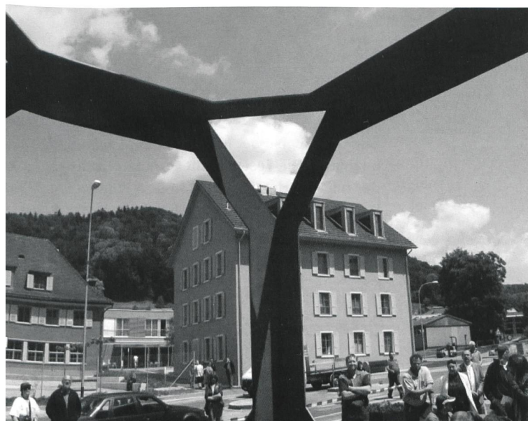
„Kunst am Bau“ - Sieger-Objekt „Sensorium“ von Florian Granwehr.

Lisbeth Suppiger: „Das alle zwei Jahre stattfindende Schlossfest soll dazu genutzt werden, um die Um- und Neubauten einzuweihen. 2001 wurde das neue Werkstattgebäude eingeweiht und im Jahr 2003 wurde das 15-jährige Bestehen des Gehörlosendorfes gefeiert. Die Einweihungsfeier bzw. das Schlossfest findet - voll auf die Zahl 9 fokussiert - am 19.09.2009, von 09.00 bis 19.00 Uhr statt. Speziell für diesen Anlass wird ein Festschriftkalender herausgegeben, in welchem vor allem auch eine Rückschau gemacht wird.“