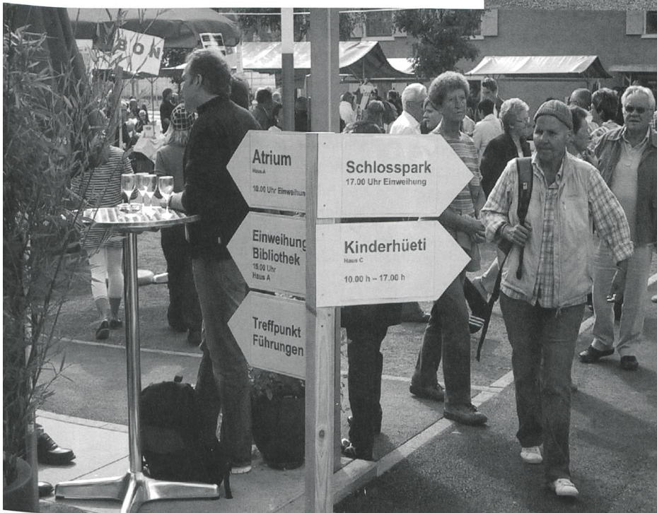
Die Feierlichkeiten sind von A bis Z perfekt organisiert.