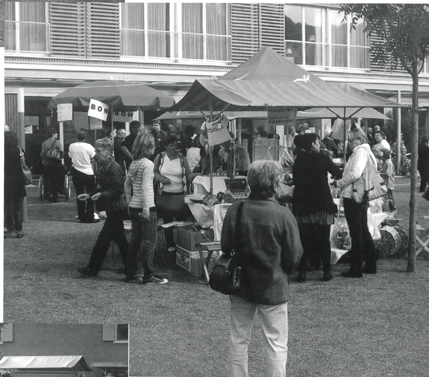
Die Festbesucher nutzen die gute Gelegenheit, um mit den Bewohnerinnen und den Bewohnern sowie den Mitarbeitenden des Gehörlosendorfes in Kontakt zu kommen.