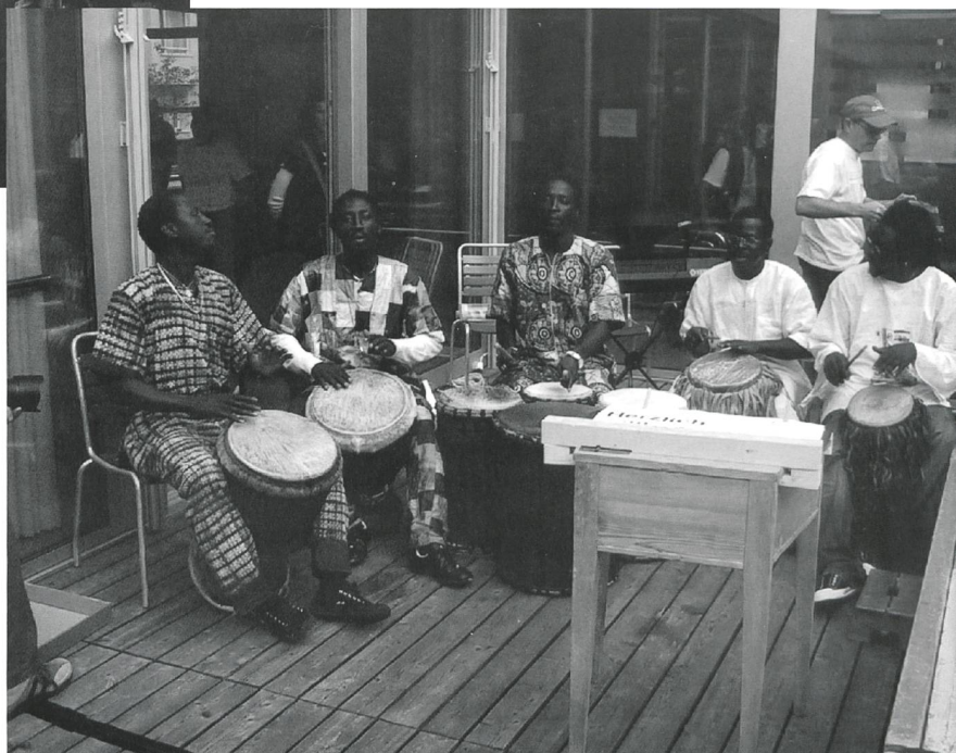
Afrikanische Trommelklänge geben der Eröffnungsfeier Rhythmus und einen ganz speziellen Charme.