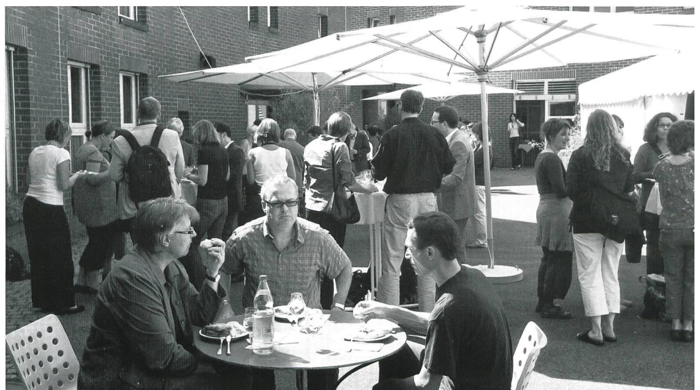
Reges Fachsimpeln der Tagungsteilnehmenden während der Mittagspause bei schönsten äusseren Bedingungen.

Ab Mitte Oktober erscheint der erste Newsletter der Tanne, den man via website bestellen kann.