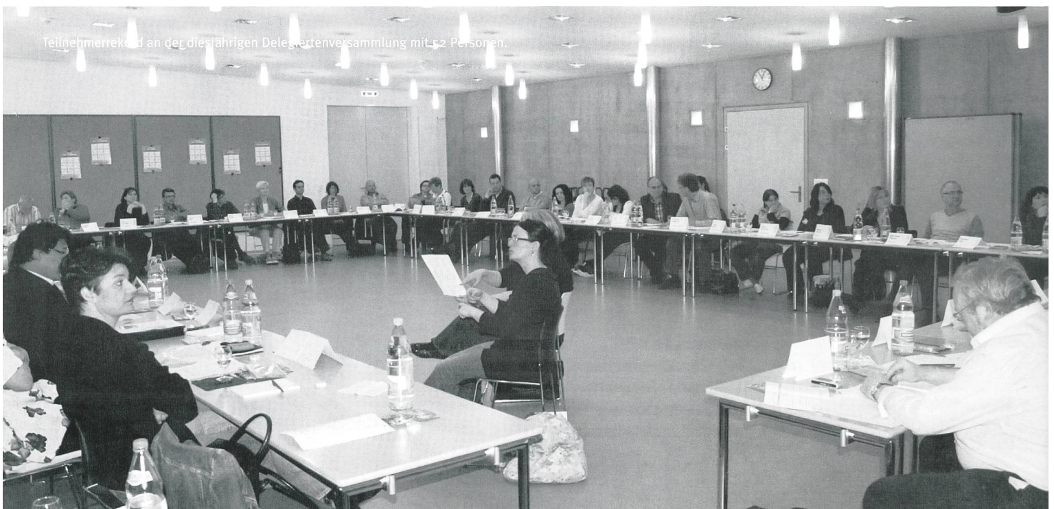
Teilnehmerrekord an der diesjährigen Delegiertenversammlung mit 52 Personen.