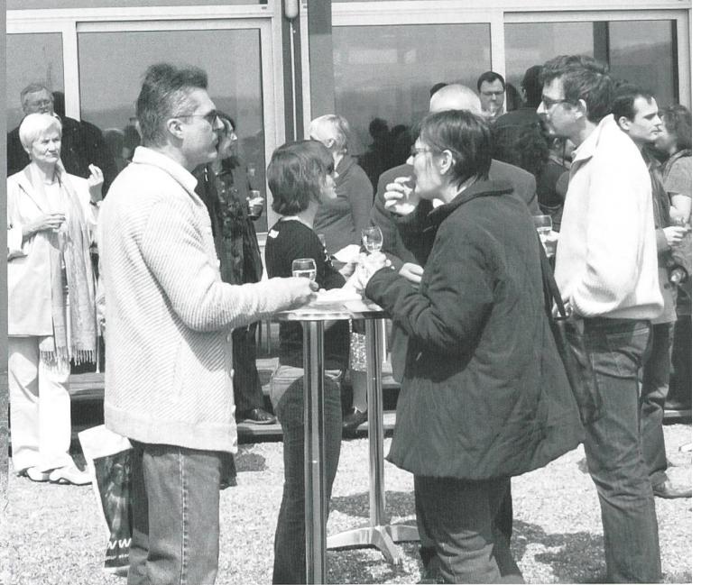
Alle genießen den Sonnenschein und die guten Gespräche während des Apéros.