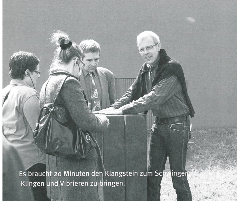
Es braucht 20 Minuten den Klangstein zum Schwingen Klingen und Vibrieren zu bringen.