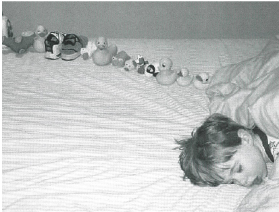
Ein kleiner autistischer Junge und die exakte Linie von Spielsachen, die er aneinander reihte.

derung können beeinträchtigte Fähigkeiten verbessert und autistische Verhaltensweisen vermindert werden.