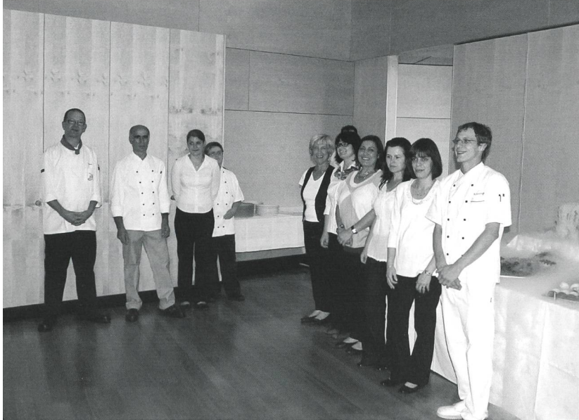
Grosses Dankeschön an das Hauswirtschafts- und Küchen-Team für die perfekte Organisation und für die spitzenmässigen kulinarischen Köstlichkeiten.