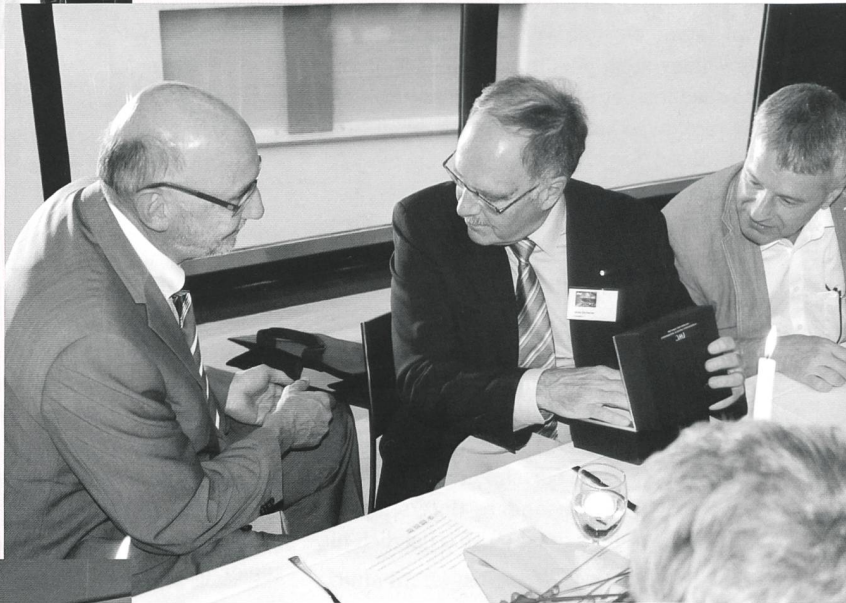
Aktive und ehemalige Schuldirektoren im Gespräch.