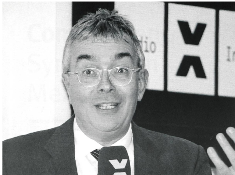
Christoph Brutschin Regierungsrat im Kanton Basel-Stadt.