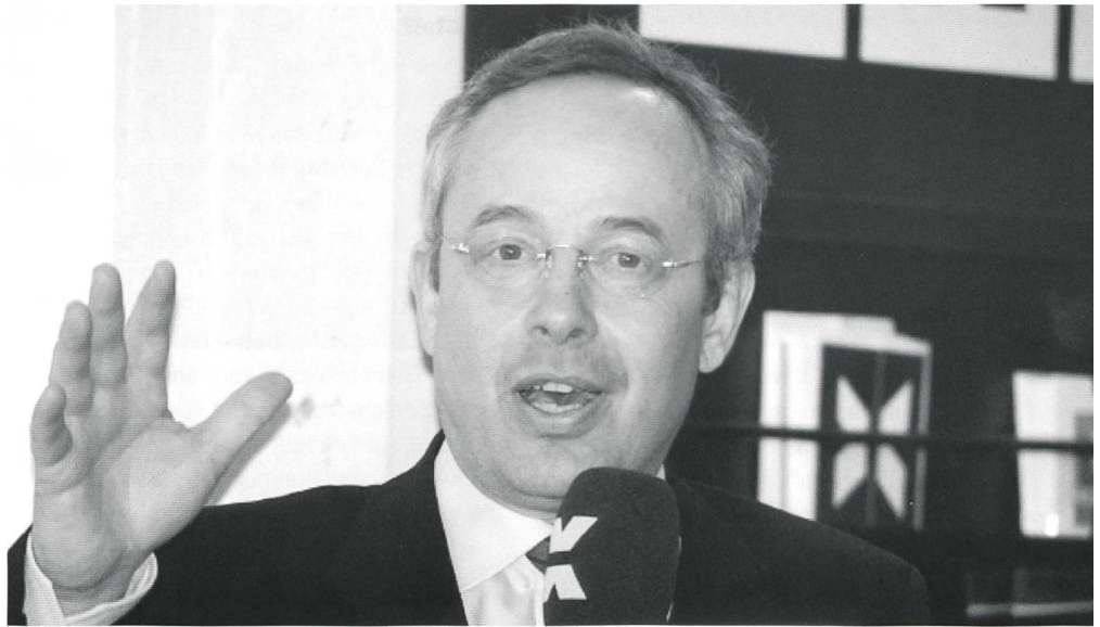
Nationalrat Peter Malama.

Am 28. März 2011 findet in Basel im ehemaligen Zollfreilager in Räumlichkeiten, die heute von Radio X genutzt werden, ein von der «CHARTA» organisierter Informationsanlass für VertreterInnen von KMUs statt. Thema bildet, wie Unsicherheiten bei Personalchefs von grösseren Firmen und KMUs behoben werden können, wenn Menschen mit Behinderungen in diesen Unternehmen beschäftigt werden. In vier Workshops werden in kleinen Gruppen Lösungen erarbeitet, um Voraussetzungen für die berufliche Eingliederung von Menschen mit Behinderung zu schaffen. Arbeitgeber mit Erfahrung, Fachstellen und Direktbetroffene – darunter auch drei Gehörlose und Exponenten der Gehörlosenfachstelle Basel – begleiten die Workshops und vermitteln praxisnahes Know-how.