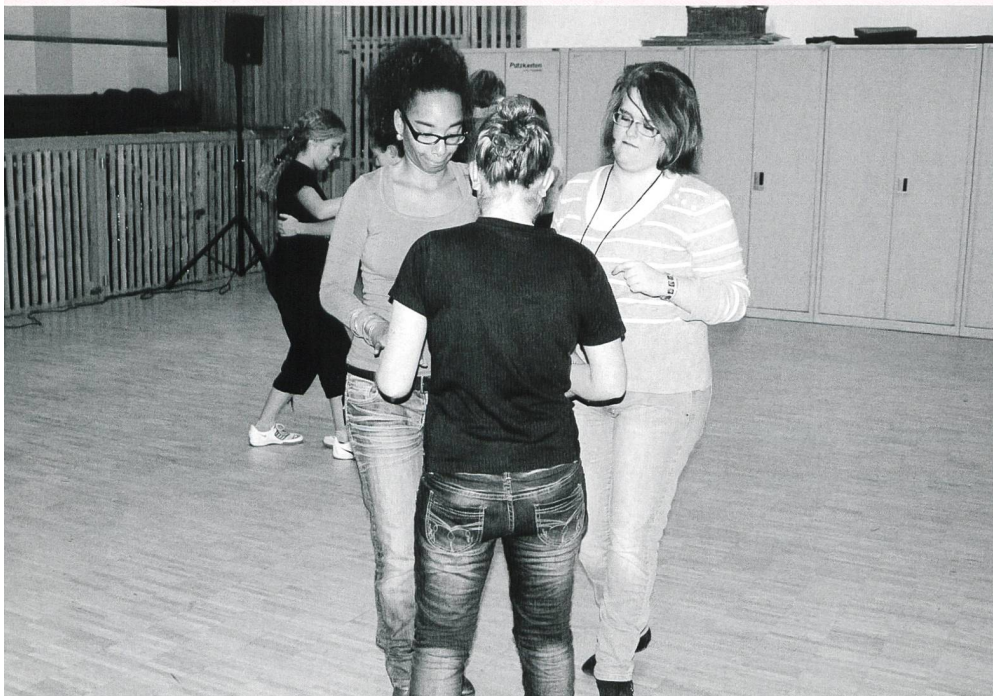
Zu jedem «treffpunkt.» sind alle 6. Klässler, Schüler und Schülerinnen der 1. bis 3. Oberstufe und Lernende, sowie Schülerinnen und Schüler der Gymnasien und des 10. Schuljahres ganz herzlich willkommen.