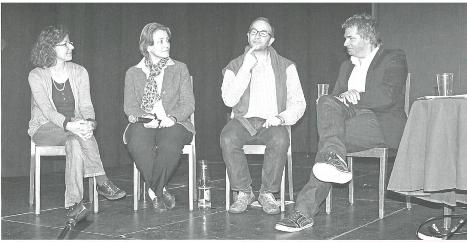
Die Podiumsteilnehmenden anerkennen, dass die Zusammenarbeit zwischen der Selbst- und der Fachhilfe in vielen Punkten gegenüber früher tatsächlich besser sei. Es seien bemerkenswerte Fortschritte erzielt worden.

tatsächlich behindert seien. Deshalb könne aus seiner Sicht der Begriff «hörbehindert» sehr wohl verwendet werden. Im Deutschen Gehörlosenbund werde der Begriff «taub» ganz aktuell wieder diskutiert. Die Schlussabstimmung über die (weitere) Verwendung des Begriffes «taub» sei noch offen. Aus seiner Sicht bedeute «taub» gänzlich nichts mehr hören, schliesst Fertig seine Ausführungen.