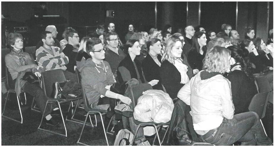
Aufmerksam verfolgen die kofo-Besucherinnen und -Besucher die Diskussion auf dem Podium.

Bemerkenswert sei das alte Hörbehinderten-Symbol bzw. die Armbinde mit den drei schwarzen Punkten auf gelben Hintergrund, welche vor mehr als vierzig Jahren von den Gehörlosen getragen werden musste. Ein ähnliches Symbol gab es auch für blinde Menschen. Es sei eine Zeit der totalen Stigmatisierung gewesen, macht Fertig geltend. Weiter informiert er noch über eine Umfrage der deutschen Gehörlosenzeitung vom 20. September 2010 und eine von Benedikt Feldmann auf «Facebook» vom Sommer 2011 mit der Frage «Welche Bezeichnung bevorzugen Sie?».