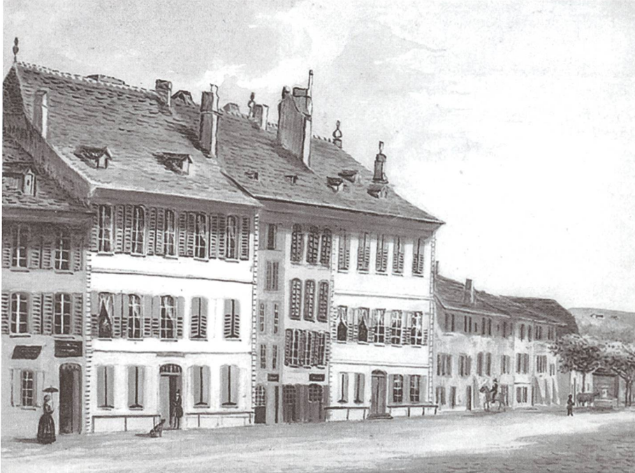
Das Gemälde von Valérie Pavid-Naef von 1846 zeigt das Institut des sourds-muets in Yverdon (Sicht von der Rue de la Plaine); in Privatbesitz.