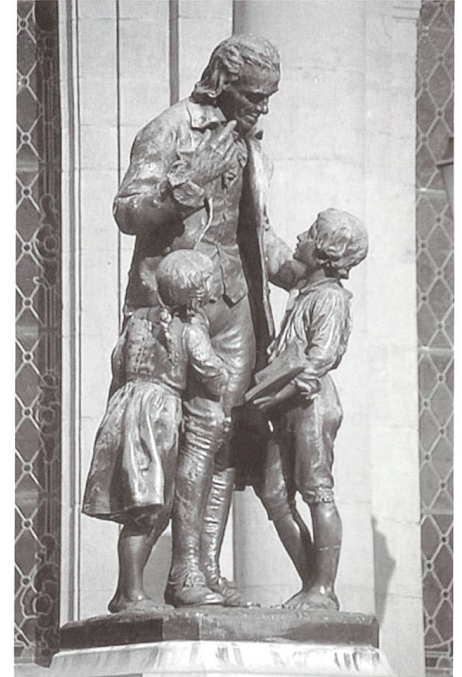
Pestalozzi-Denkmal in Yverdon.