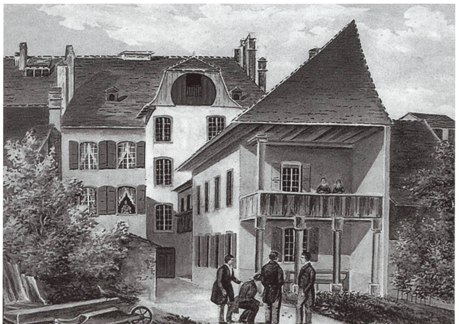
Ein weiteres Gemälde von Valérie Pavid-Naef von 1846 zeigt ein paar Schüler im Garten des in Yverdon im Jahre 1813 gegründeten Instituts des sourds-muets an der Rue de la Plaine [Privatbesitz].