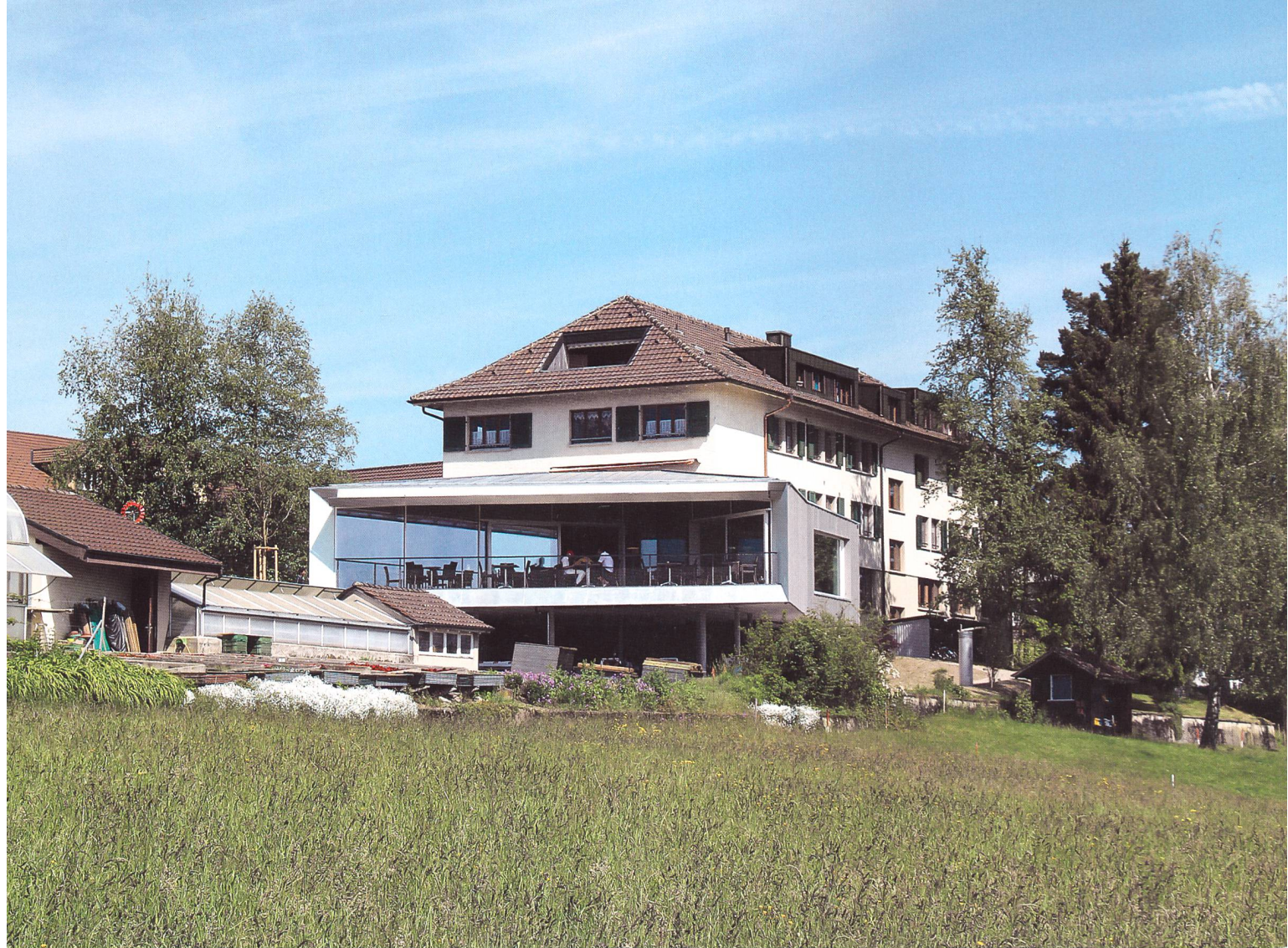
Das neu gebaute Restaurant Alpenblick mit Terrasse und Aussicht auf das Alpenpanorama.