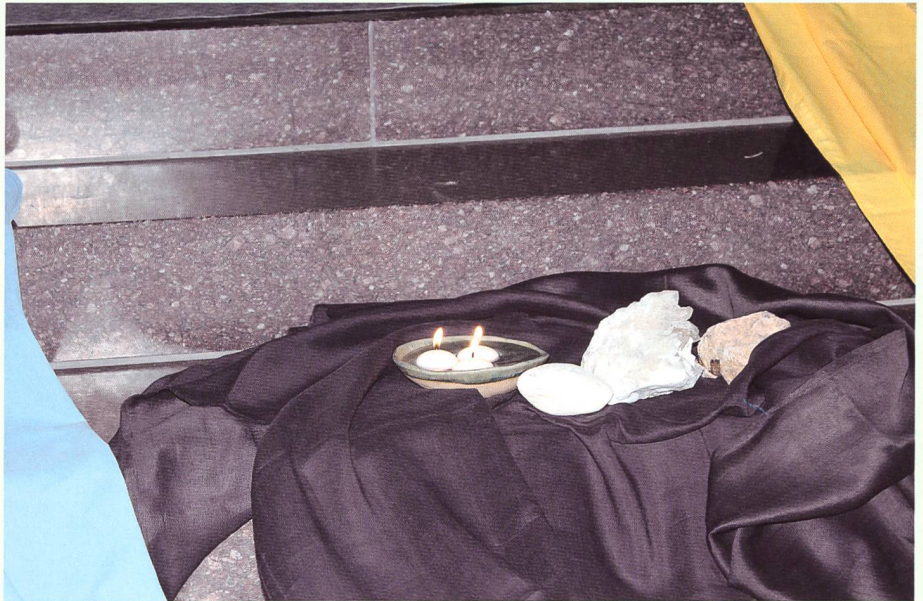
Symbole des Advents schmückten den liebevoll gestalteten Altar..