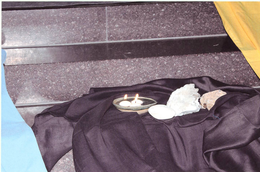
Symbole des Advents schmückten den liebevoll gestalteten Altar..