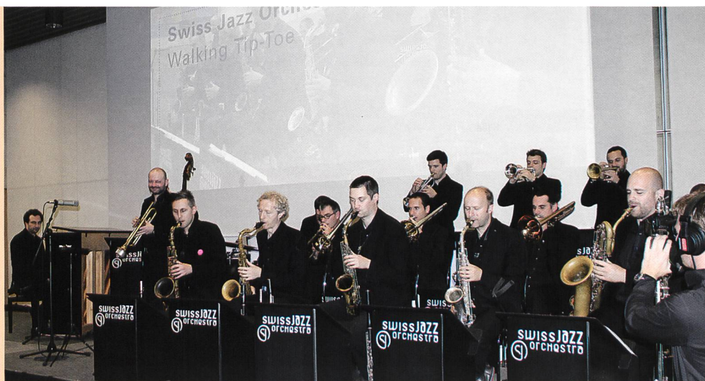
Swiss Jazz Orchestra.

Seit 60 Jahren bietet die Berufsschule für Hörgeschädigte Zürich Berufsbildung für Lernende mit besonderem Förderbedarf an. In den vergangenen 10 Jahren warben Jahr für Jahr jeweils vier Botschafterinnen und Botschafter auf überdimensionalen Plakaten mit ihren Gesichtern für die schweizweit einmalige Schule in Zürich-Oerlikon. In einem Buch werden die 40 Ehemaligen der Jahre 2004 bis 2014 porträtiert und geben Einblick in den erlernten Beruf sowie ihren heutigen Arbeitsplatz und ihr aktuelles Wirkungsfeld. Es entstand ein Buch, mit 40 spannenden Ausbildungsgeschichten.