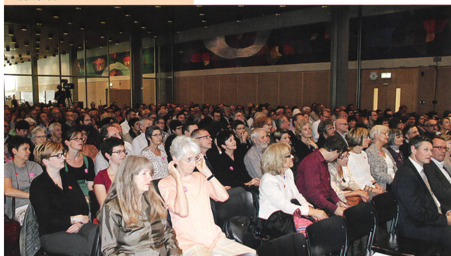
Aufmerksame Zuhörerinnen und Zuhörer.

Mit einem musikalischen Feuerwerk werden die Jubiläumsfeierlichkeiten am 26. September 2014 im Anton Graff Schulhaus in Winterthur eröffnet. Das Swiss Jazz Orchestra spielt auf und bringt die bis auf den letzten Platz gefüllte Aula mit ihren ausgewählten «Musik-Köstlichkeiten» so richtig in Feststimmung.