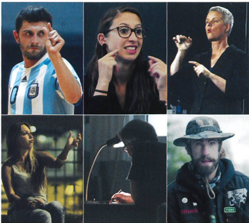
Hear my Story: sechs eindrückliche Porträts.

Alle Filme sind online verfügbar: www.hearmystory.ch