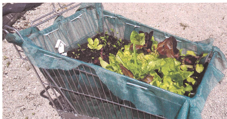
Wer Gartenarbeit liebt, kann die Einkaufswägeli-Bepflanzung auch bei Regen hegen: im Trockenen, im Haus.