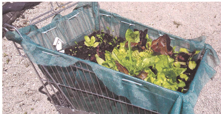
Wer Gartenarbeit liebt, kann die Einkaufswägeli-Bepflanzung auch bei Regen hegen: im Trockenen, im Haus.