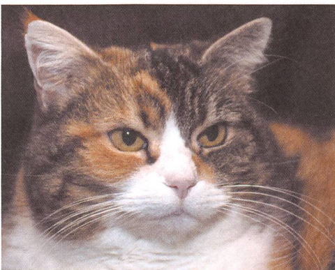
Katze Miggeli spürt oft, wer sie braucht, und wartet dann vor der entsprechenden Zimmertür.