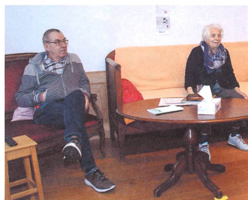
In der Stube wird im Fernsehen gerade Skirennen geschaut.