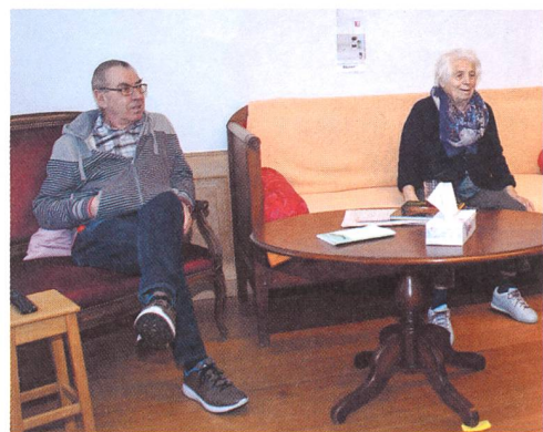
In der Stube wird im Fernsehen gerade Skirennen geschaut.