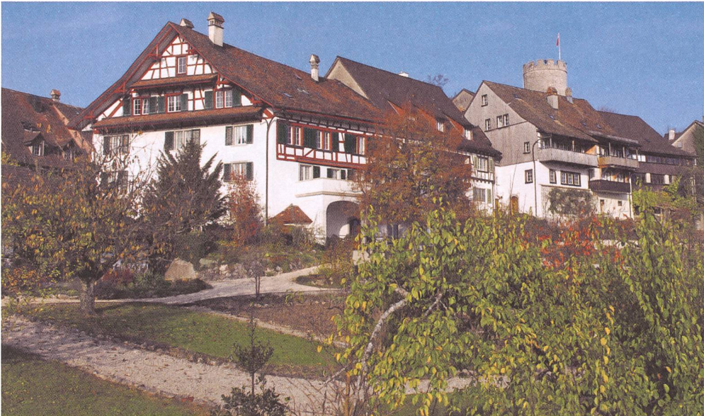
Das Hirzelheim in seiner üppigen Grünanlage, dahinter die befestigte Altstadt von Regensburg.