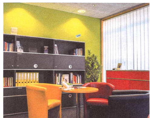
Freundlich und modern eingerichtet: der Empfangsraum im Walkerhaus.