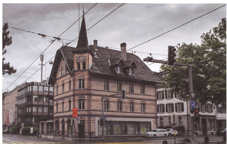
Die IGGH hat ihre Büros im schönen Walkerhaus, nahe dem Bahnhof Bern.