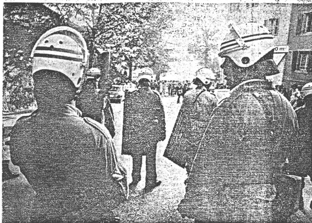
Rue de l'Université: les jeunes ne passeront pas.