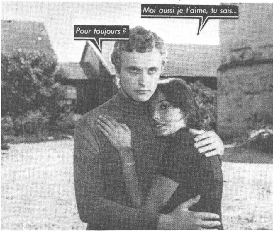
Les codes gestuels : "baiser"