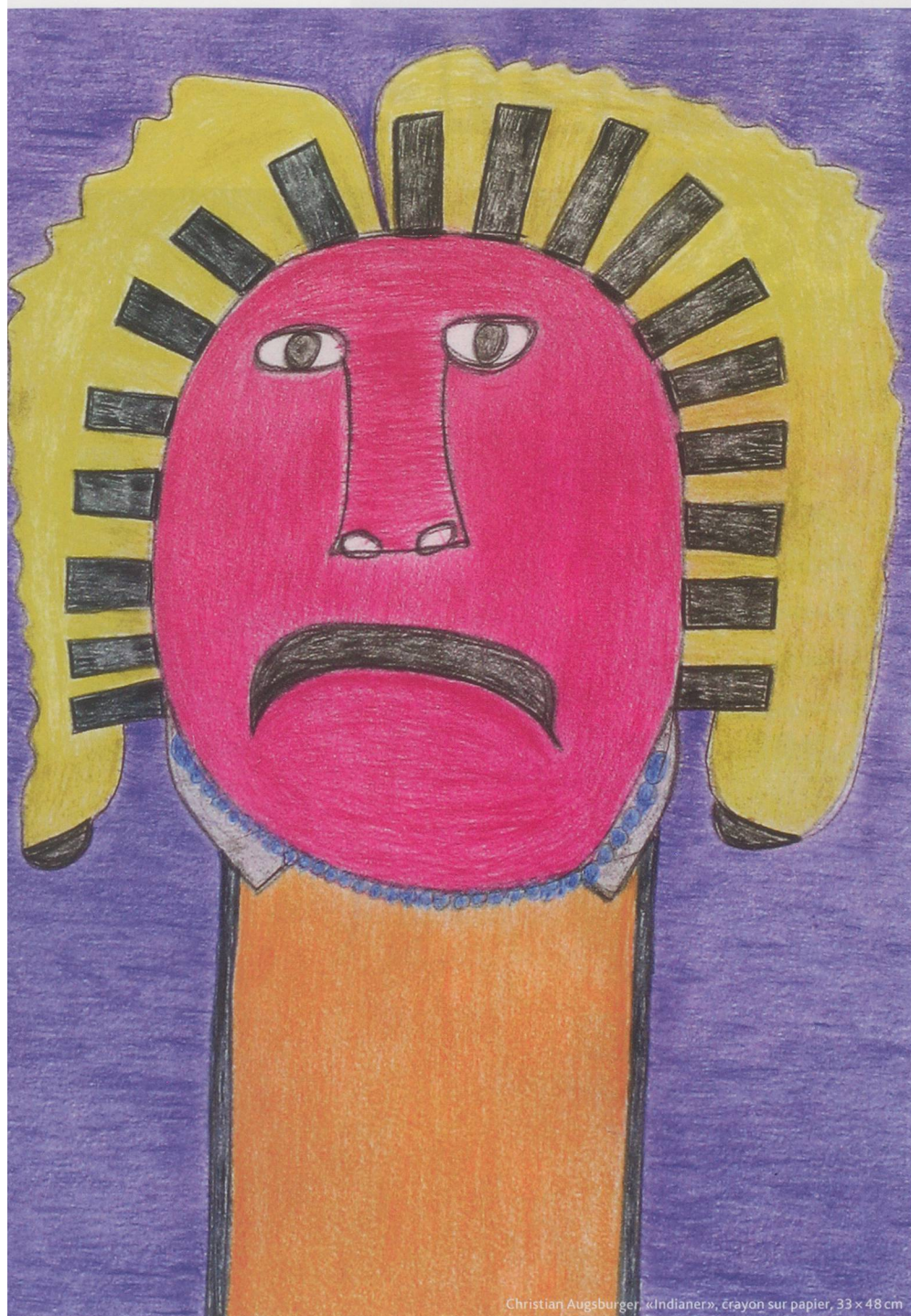
Christian Augsburger, «Indianer», crayon sur papier, 33 x 48 cm

ramenés de voyage. Il n'a jamais eu de télévision de sa vie. Un ordinateur récupéré chez son frère, oui, mais sans connexion internet.