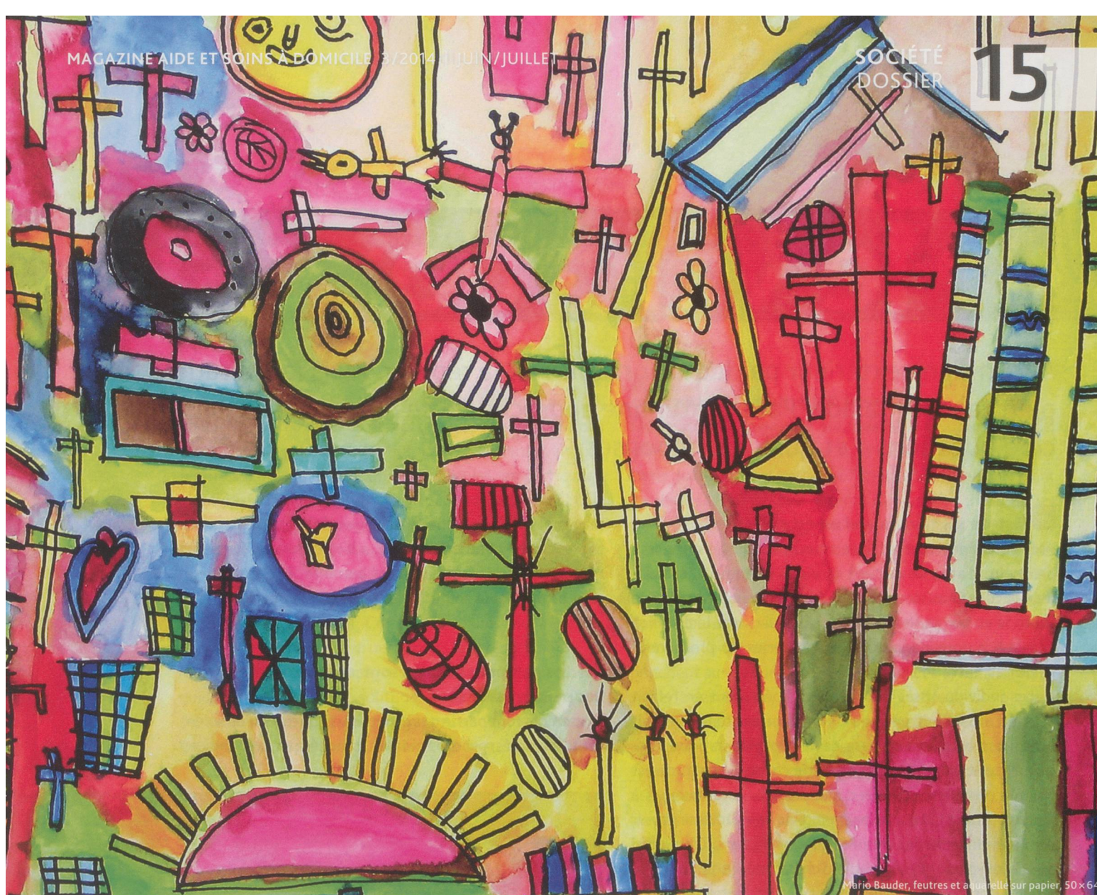
Mario Bauder, feutres et aquarelle sur papier, 50 x 64