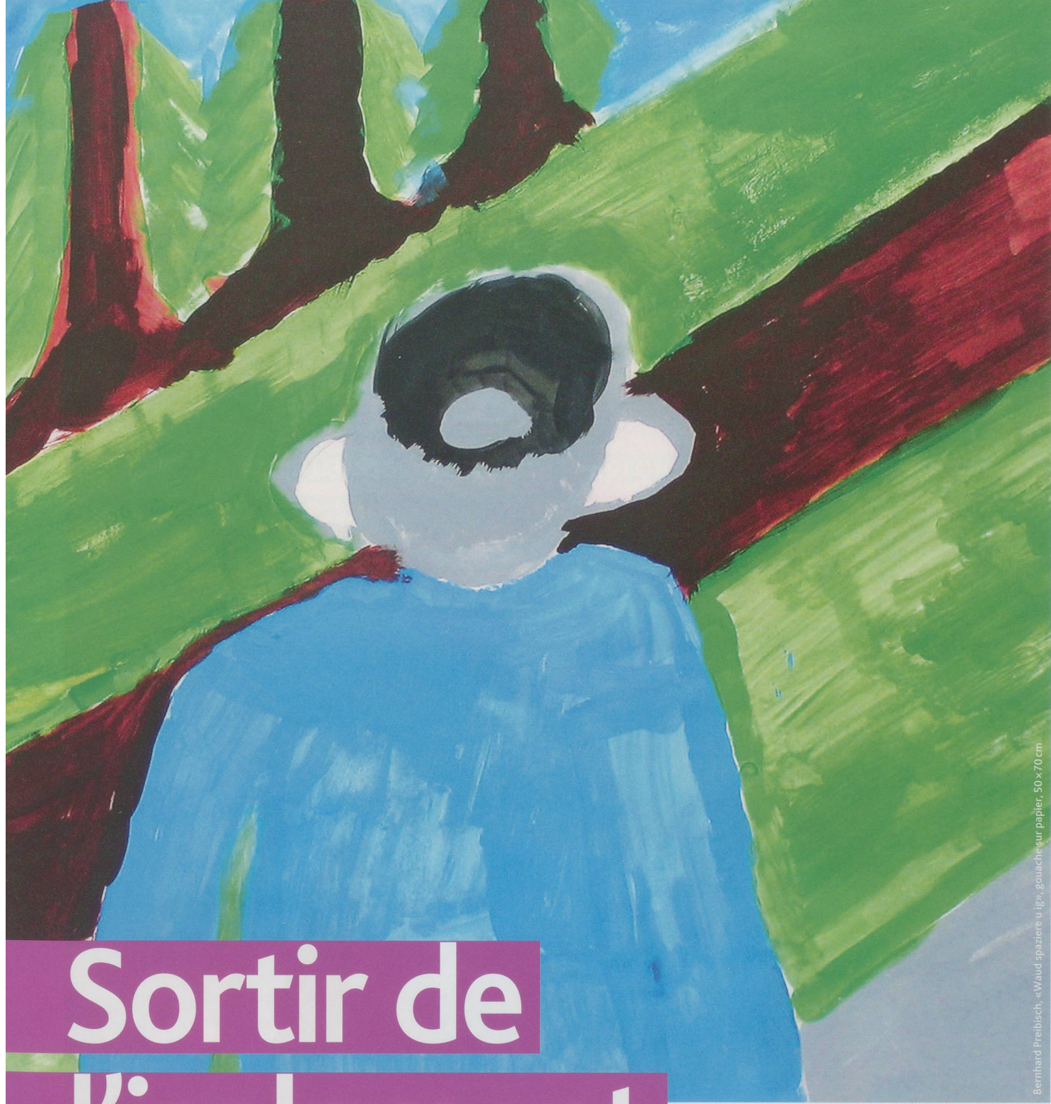
Bernhard Preibisch, «Waldspaziere u Ig», gouache sur papier, 50 x 70 cm