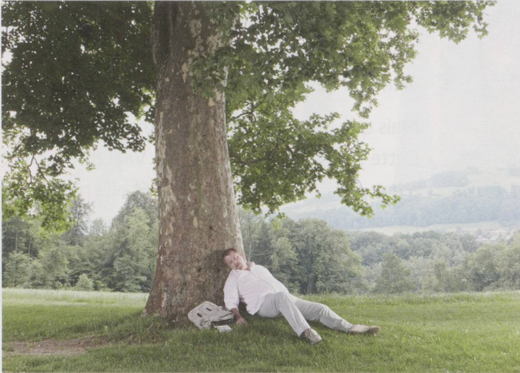
Une fatigue diurne fréquente peut être un signe.

red. Pendant le sommeil, on peut être gêné sans le savoir par des interruptions répétées et incontrôlées de la respiration. Ainsi, certaines personnes connaissent plusieurs dizaines, voire plusieurs centaines d'apnées au cours d'une même nuit, sans en être nécessairement conscients. Ce phénomène est dû au relâchement des muscles des parois du pharynx, qui cause la fermeture répétée du conduit