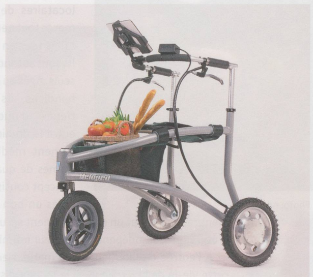
Le déambulateur intelligent iWalkActive est un petit engin tout terrain capable de transporter des charges, muni d'un système de navigation adapté aux besoins spécifiques des seniors.

l'aide se trouve. Cette personne aperçoit ensuite sur l'écran un visage familier, ce qui la rassure. Si nécessaire, la personne de confiance demandera de l'aide. Le succès de cette application dépend du nombre de personnes participant à cette communauté d'assistance. «Une collaboration entre proches et des professionnels comme les organisations d'aide et de soins à domicile serait idéale. Quand les proches ne sont pas disponibles, les services professionnels prennent la relève», dit Rolf Kistler.