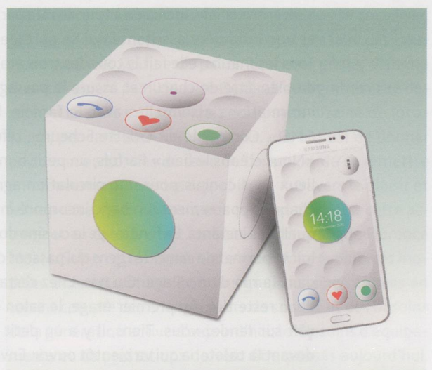
Le cube Relaxed Care est placé dans l'appartement de la personne âgée et dans la résidence d'un proche. Il indique l'état et la situation de vie des personnes ainsi reliées avec un scintillement coloré.