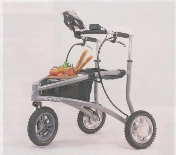
Le déambulateur intelligent iWalkActive est un petit engin tout terrain capable de transporter des charges, muni d'un système de navigation adapté aux besoins spécifiques des seniors.