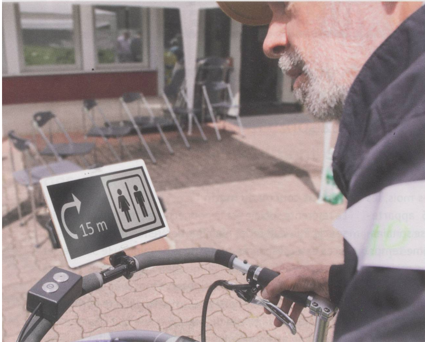
Le système de navigation d'iWalkActive indique le chemin vers les toilettes publiques les plus proches.