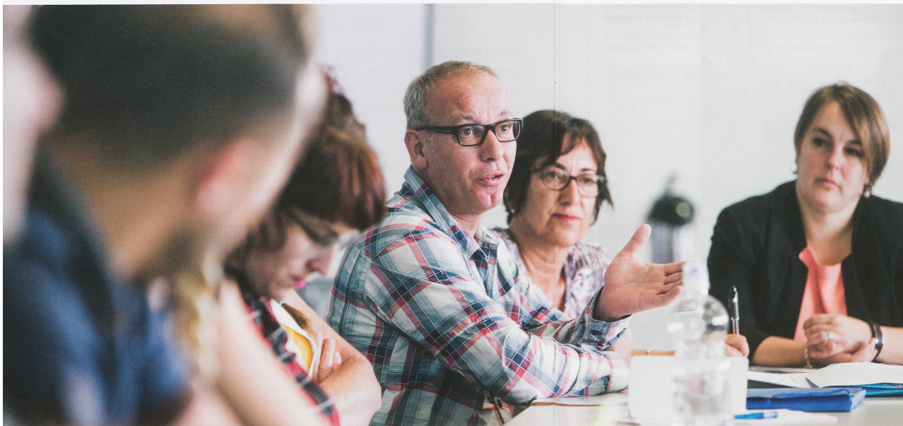
La séance d'accueil des nouveaux collaborateurs imad fait partie des dispositifs de formation et a lieu chaque mois.

tion des ressources humaines et de formation, elle doit pouvoir les intégrer dans la politique cantonale et s'appuyer sur un système de formation réactif», précise, à ce sujet, Sandrine Fellay Morante.