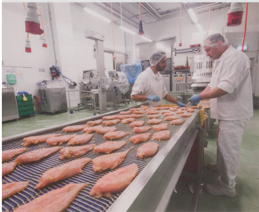
Du filet de poulet en route pour les «Menus Mobiles».

Dans les bâtiments de Traitafina SA à Lenzburg, en Argovie, des repas sont confectionnés pour le service de livraison qu'offrent 25 organisations d'aide et de soins à domicile. De nombreuses personnes œuvrent pour que ces menus, préparés à base de produits frais, trouvent leur chemin jusque sur la table des clients.