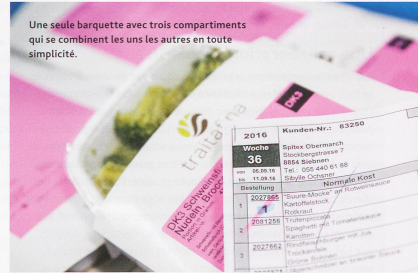
Une seule barquette avec trois compartiments qui se combinent les uns les autres en toute simplicité.