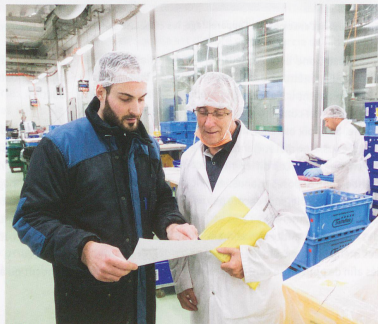
Chaque vendredi, les repas destinés aux organisations d'aide et de soins à domicile sont préparés pour la livraison.