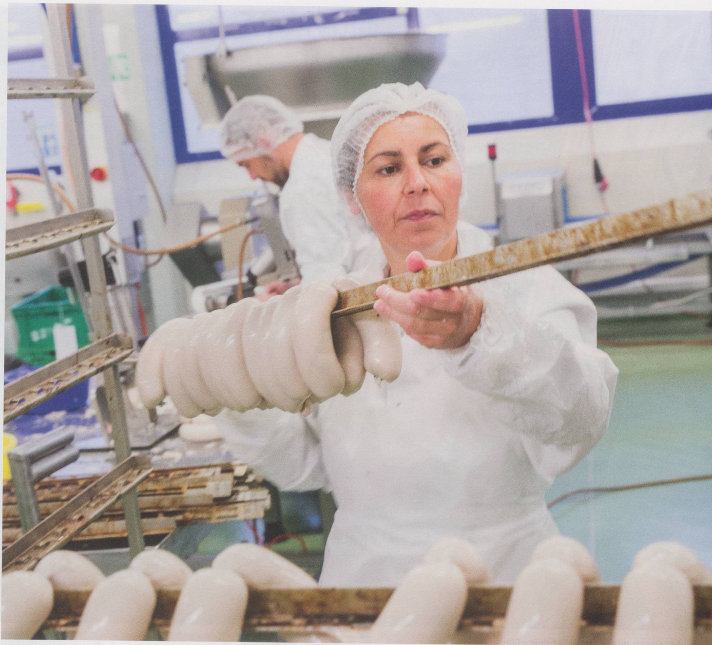
En traversant l'ensemble de l'appareillage, les chipolata sont épicées puis suspendues pour être séchées.

Soudain, une bonne odeur de viande rôtie embaume l'air. Nous pénétrons dans l'énorme cuisine de Traitafina où se préparent les menus dits mobiles. Treize personnes y travaillent et confectionnent quelque 5000 repas par semaine. Le choix est énorme, Traitafina proposant plus de 300 menus. Une diététicienne calcule les valeurs nutritives de chaque plat. Les différents accompagnements et la viande sont déposés manuellement dans les barquettes qui, pour contrôle, sont encore pesées séparément. Comme des normes alimentaires très strictes assurent la qualité des mets, la quantité des aliments joue un rôle essentiel. Les menus sont ensuite pasteurisés à 72 degrés et emballés afin de pouvoir se conserver au moins 18 jours. Chaque