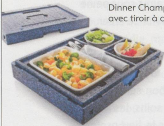
Dinner Champion II avec tiroir à couverts

En très bon état, idéal pour la livraison de repas chauds ou froids.