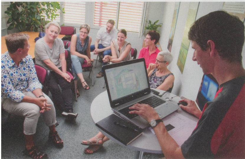
Les résultats de l'analyse de site et de zone sont discutés lors d'un atelier.

De nouvelles agglomérations, plus d'habitants et plus de trafic: les services d'aide et de soins à domicile (ASD) doivent s'adapter à temps aux changements que connaissent leur région. Mais, grâce aux données toujours plus nombreuses, à un programme informatique intelligent et à quelques ateliers constructifs, il devient possible de localiser le site le mieux adapté aux services d'ASD pour être à l'avenir encore plus proche de ses clients.