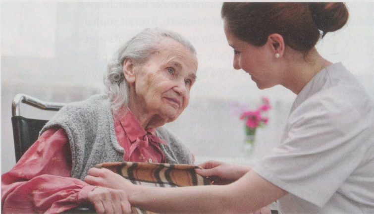
Les projets améliorent la gestion du stress et des compétences.

La pénurie de personnel dans les professions de santé constitue un défi majeur pour le système de santé suisse. D'ici à 2030, les effectifs d'infirmiers et d'infirmières, qui représentent la plus importante catégorie professionnelle du secteur de la santé, seront en déficit de 65 166 personnes, principalement dans les soins de longue durée ainsi que dans l'aide et les soins à domicile (ASD).