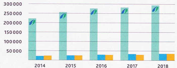
Evolution du nombre total de clientes et de clients de l'ASD par type de fournisseurs de services.

augmenté et s'élève à 27 %. Cette évolution confirme que les services de soins ambulatoires offrent de plus en plus de soins spécialisés et que l'ASD à but non lucratif est présente pour tous dans différentes situations de vie. Reste que le nombre d'heures par client et par année est deux fois moins élevé dans les services d'ASD à but non lucratif (50) que dans les organisations à but commercial (116). Dans le domaine de l'aide au ménage et de l'accompagnement, il est même quatre fois inférieur: 38 heures contre 151. Cette différence s'explique: les