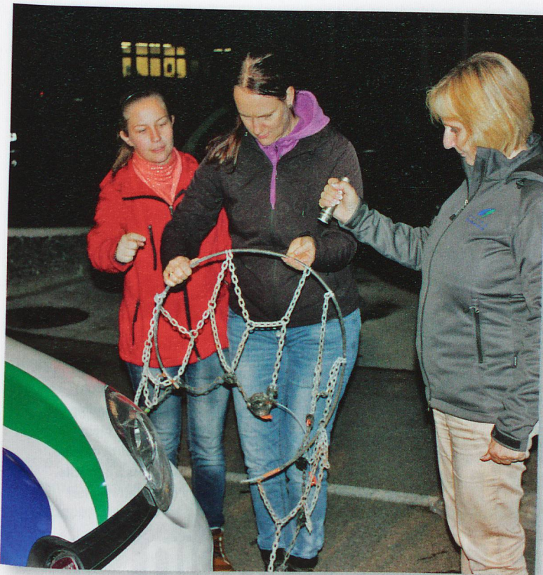
La pose des chaînes à neige figure au cours.