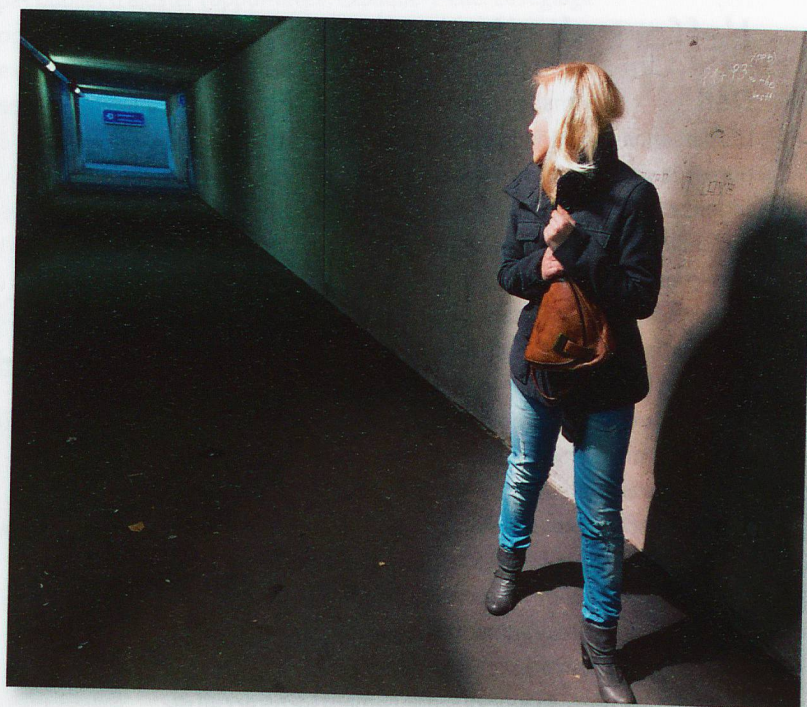
La nuit, les employés des soins à domicile se sentent souvent mal à l'aise sur le chemin du travail.

L'organisation d'ASD de la ville de Lucerne propose différentes mesures et aides pour davantage de sécurité durant la nuit. Si un travailleur de nuit se sent en insécurité, il peut solliciter la présence d'un autre employé, annuler l'intervention et la réaliser plus tard – ou faire appel à la police en cas d'urgence. En l'absence d'éclairage, les supérieurs hiérarchiques veillent aussi à optimiser la situation. «Parfois l'ha-