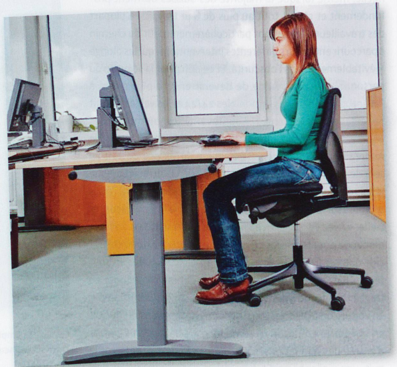
Manière correcte de se tenir à son bureau, selon la Suva.

Au cours de leur formation, les soignants apprennent les postures favorables à la préservation de leur santé en cas de mobilisation des clientes et des clients. Celui qui souhaite rafraîchir ses connaissances peut s'appuyer sur la brochure «Sécurité au travail et protection de la santé dans le secteur de l'aide et des soins à domicile», publiée par la Commission fédérale de coordination pour la sécurité au travail (CFST).