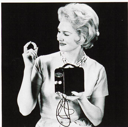
Un coup d'œil vers le passé: les appareils auditifs d'autrefois.

La perte auditive reste cependant encore chargée de nombreux préjugés. La honte de porter des appareils auditifs est souvent encore bien présente – même si elle est injustifiée. Car la «banane» derrière l'oreille, c'est du passé depuis longtemps : au cours des dernières décennies, les appareils auditifs sont devenus de minuscules appareils high-tech proposant constamment de nouvelles et multiples fonctionnalités. Les appareils auditifs numériques sont depuis longtemps