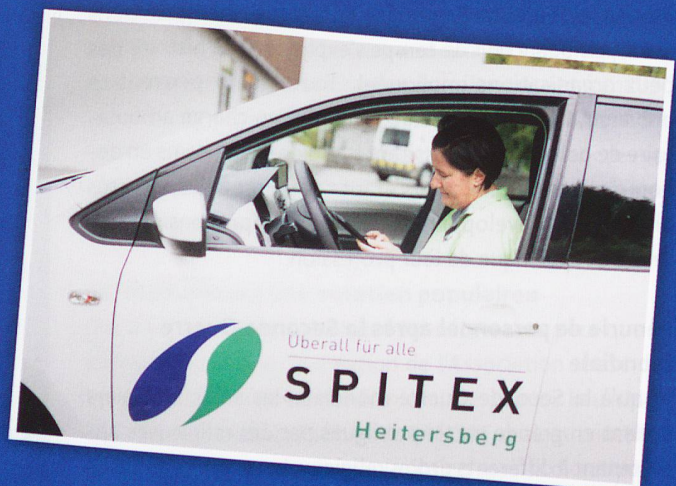
Véhicules modernes, outils informatiques et technologie médicale font partie des soins ambulatoires aujourd'hui.