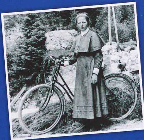
Les congrégation religieuses, comme celle des soeurs de Sainte-Anne à Lucerne, ici dans la première moitié du 20 e siècle, ont fourni un travail de pionnier