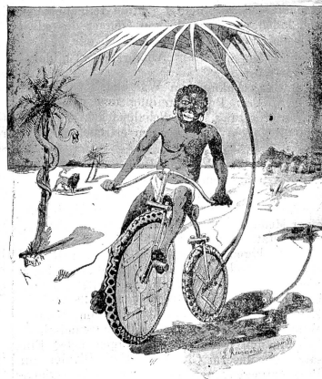
Praktischer Ersatz für Pneumatikräder.