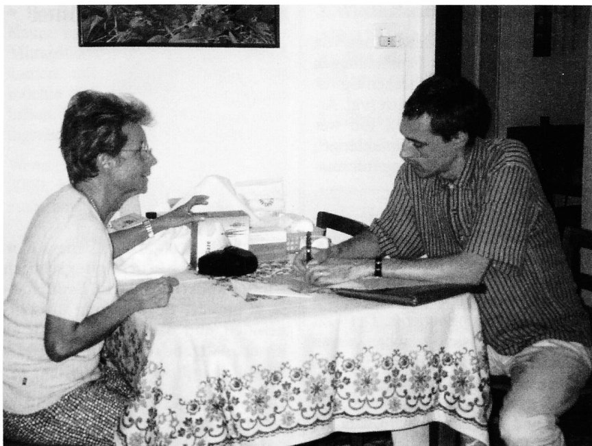
Das Procedere wird besprochen und schriftlich festgehalten.

begrüsst und als notwendig und sinnvoll erachtet, es wurden lediglich Zweifel an deren Umsetzung, vor allem ärztlicherseits, geäußert. Wichtig sei, dass die Einführung schrittweise geschehe und genug Zeit zur Verfügung stehe. Eine gewisse Resignation war für mich aus den Bemerkungen spürbar.