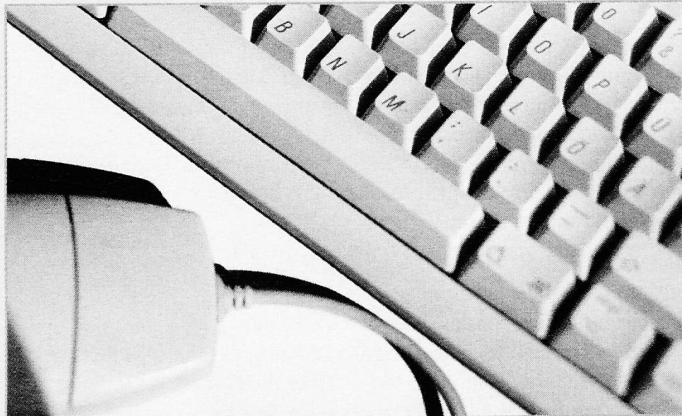
Thema der Regiotreffen: Das Angebot verschiedener Software-Hersteller zur Kostenrechnung.

Zum Frühherbst in der St. Galler Spitex-Landschaft gehören die traditionellen Regionaltreffen. Der Verband des Kantons St. Gallen lädt dabei in vier regionalen Zentren die Mitgliedorganisationen zum Informationsaustausch ein.