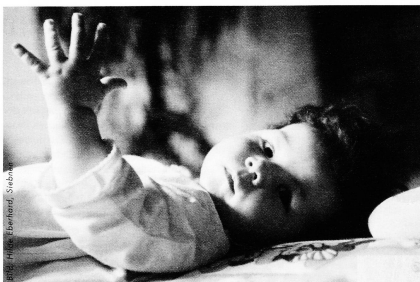
Die Kinderspitex als Teil einer notwendigen Spezialisierung in der ambulanten Pflege?