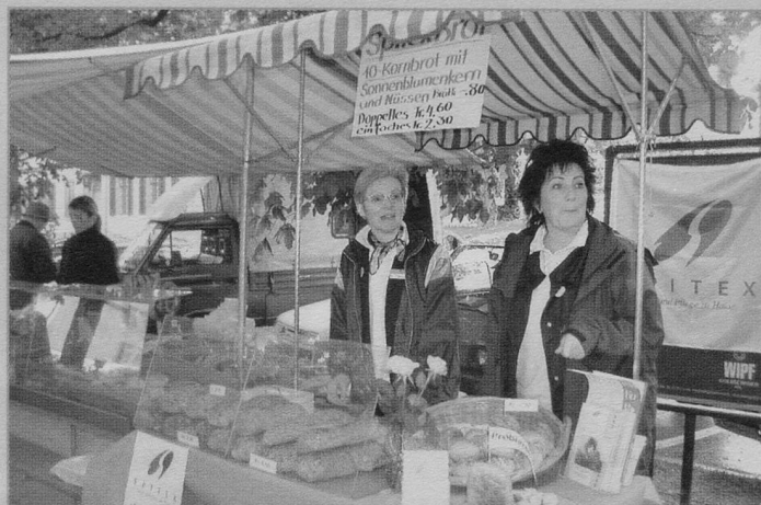
Dank zahlreichen Aktivitäten war die Spitex am 3. Mai im Thurgau nicht zu übersehen.

Auf ihrem Rundgang durch den Kanton Thurgau konnten sich