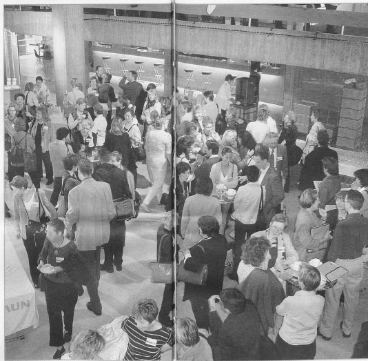
Persönliche Begegnungen – ein wichtiger Teil des Kongresses.

Die empirischen Daten unterstützen die zweite These: Frauen