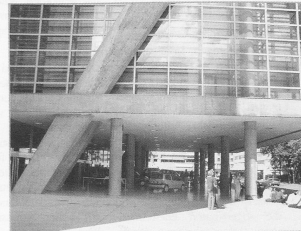
Der Tagungsort – das Kongresszentrum Biel.