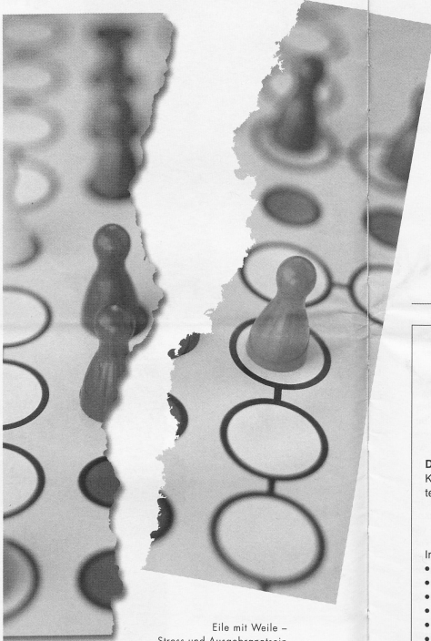
Eile mit Weile – Stress und Ausgebranntsein sind ein Nährboden für Gewalt und Aggression.