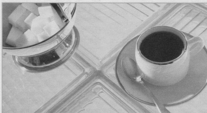
«Pausen und Pausengestaltung» war eines der Themen im Projekt zur betrieblichen Gesundheitsförderung in der Spitex-Fluntern.

Die Ziele des Gesundheitsförderungsprojektes, das Brunhilde Hug-Weiss, dipl. Physiotherapeutin mit einer Zusatzausbildung in Ergonomie (ErgonPT), im Mai 2002 bis Mai 2003 in der Spitex Fluntern durchführte, waren weniger hoch gesteckt: Grundpflege