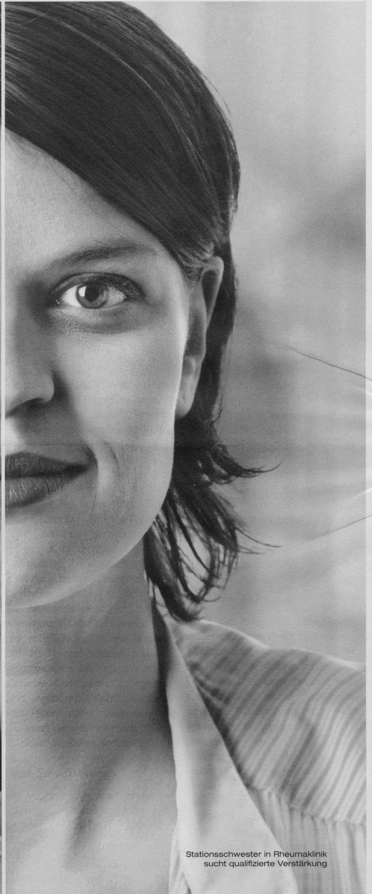
Stationsschwester in Rheumaklinik sucht qualifizierte Verstärkung

Wer jobmässig perfekt zusammenpasst, findet sich jetzt noch schneller auf Jobwinner. Die bewährte Stellenplattform mit neuem Design und vielen zusätzlichen Funktionen, dank denen Stellensuchende und Stellenanbieter noch einfacher zusammenfinden. Und wie bisher mit der einzigartigen Print-/Online-Kombination Jobwinner-Kombi.